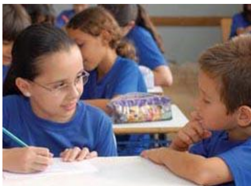
Figura 2 - Todos Participam: os alunos mais velhos servem de escribas para os mais novos para não haver problemas de compreensão