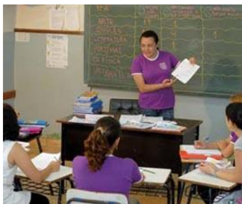
Figura 1: Conselhos de classe em mão dupla