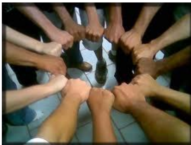
Figura 3 - Educação em Rede Grêmio Estudantil